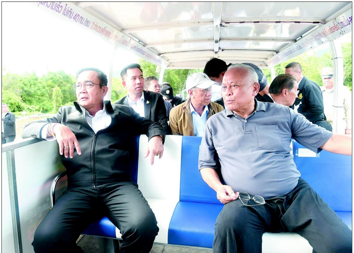
พล.อ.ประยุทธ์ จันทร์โอชา นายกรัฐมนตรี และ รมว.กลาโหม นั่งรถร่วมกับนายสุเทพ เทือกสุบรรณ ผู้ร่วมก่อตั้งพรรครวมพลัง ประชาชนชาติไทย (รบช.) เยี่ยมชมการเรียน การสอนของวิทยาลัยอาชีวศึกษามหาวิทยาลัยเทคโนโลยีคุณ ต.หน้าเมือง อ.เกาะสมุย จ.สุราษฎร์ธานี

ต่อมาเวลา 09.50 น. นายฯ และ คณะเดินทางด้วยรถโตโยต้าแวลโวไฟร์ สีขาว ทะเบียน 7 กพ 1333 กรุงเทพมหานคร ตรวจเยี่ยมพื้นที่ก่อสร้างประตูระบายน้ำ คลองท่าเรือ-หัวตรุด กิโลเมตรที่ 9+200 โดยได้รับฟังรายงานความก้าวหน้าของโครง การก่อสร้างประตูระบายน้ำ และรับทราบ รายงานการแก้ไขปัญหาการกัดเซาะชายฝั่ง ทะเล การก่อสร้าง พร้อมกล่าวว่า ขอให้ ช่วยกันทำความเข้าใจกับประชาชนที่ยัง ไม่ให้ความร่วมมืออีก 58 ครัวเรือน ว่าถ้า โครงการนี้สำเร็จจะแก้ปัญหาหน้าท่วมได้ถึง ร้อยละ 80 หากรัฐบาลทำความเข้าใจฝ่าย เดียวประชาชนจะไม่เข้าใจ จึงอยากให้ชาว บ้านช่วยกันบอกถึงผลดีคืออะไร สำหรับโครงการนี้เริ่มดำเนินการได้